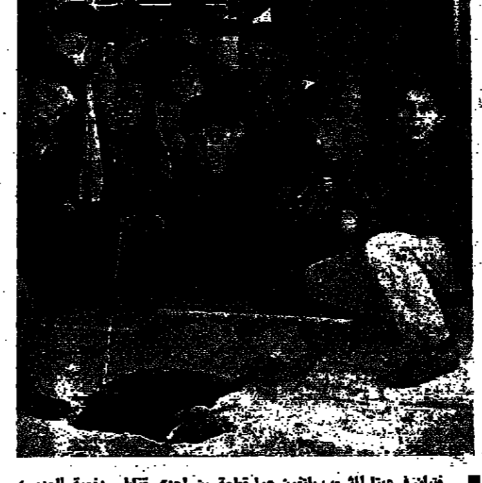
خيان في ميلا الشعب يلطون حول تلمة من احدى قتال مدفعية العدو ، وامامهم حفره احدثها احدى هذه التلطليل

صيدا - من نزيه نقوزي : قصفت مدفعية العدو عدة مناطق في الجنوب امس . تعرض وادي الزرقا الممتد بين يارين والقصيرة والتلال المحيطة ببادية البستان ، للقصف الاسرائيلي . وقد تساقطت قتال مدفعية العدو على بلدة ميلا الشعب ، وتوق القتال المرشحة على البلدة ، اتخذت مجزرتان اسرائيليان موقفا في مكن جديد اقيم للمرافعة . وفي القصيرة يقضاه صومر ، سمعت طلقت الاسلحة الرشاشة امس . ( التفاصيل على الصفحة ٤ )